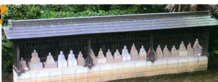
約20体のお大師様が並び1番の見どころ