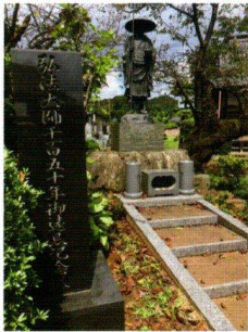
浄観寺にある修行大師像