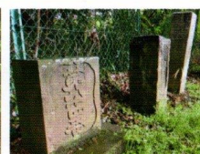
大師堂右脇に台座も