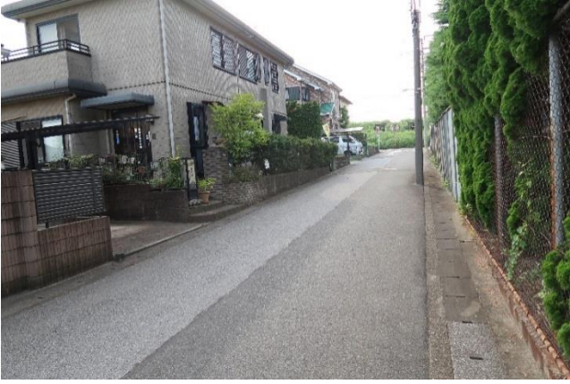
流山キックマン（株）南側の道路