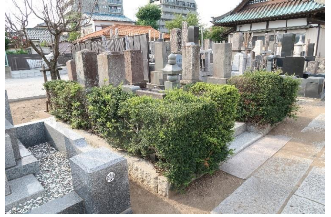
安藤家の墓（常与寺墓地）側面