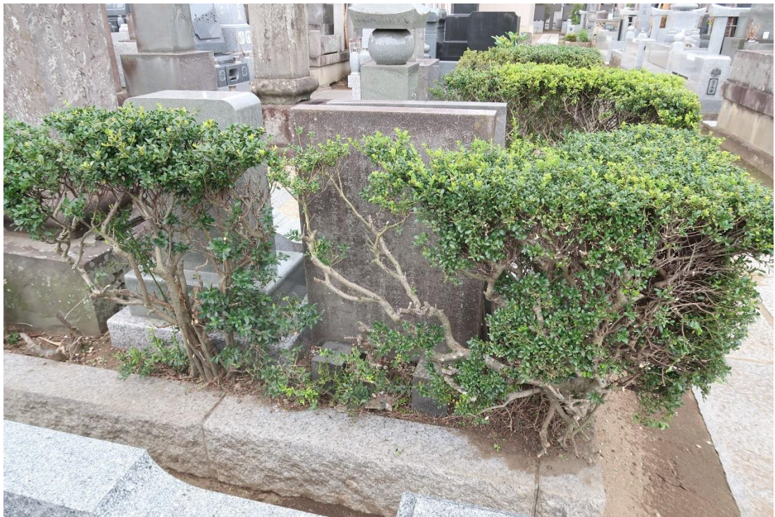
回向墓誌裏面（2022/08/06 撮影）