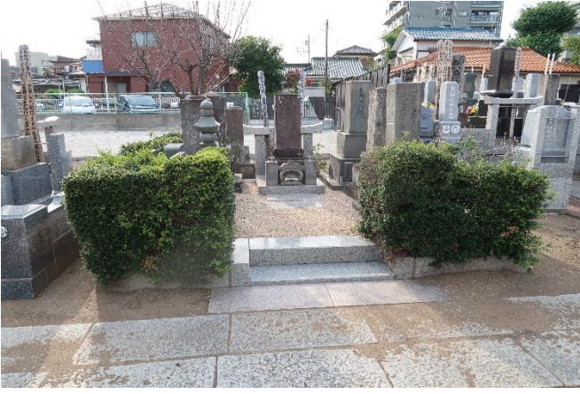
安藤家の墓（常与寺墓地）正面